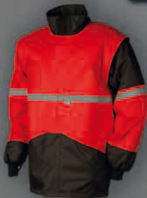
Gilet détachable avec manches détachables